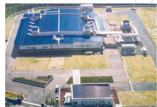
創業時の三重工場（写真は1987年）

私たちの身のまわりでは現在、 目まぐるしい技術革新が続いています。 当社はその歩みを高品質な特殊ガスの 安定供給で支えるプロ集団です。 みずからハイレベルな品質基準を課して、 生産・充填・分析技術を研鑽。 高度な容器内洗浄技術なども徹底し、 常に最高品質のガス製品を生産しています。 工場と販売元を緊密な受発注情報で結び、 これからも万全な生産・納品体制のもと、 皆さまに高品質な特殊ガスをお 届けしてまいります。